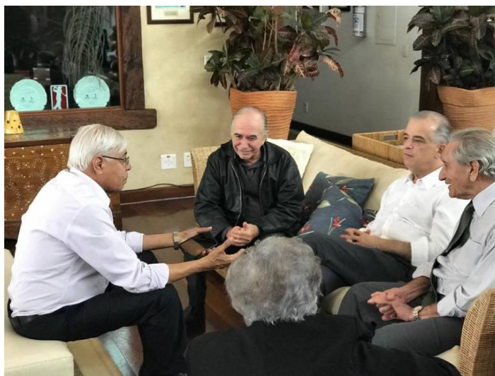
Diálogo com o governador